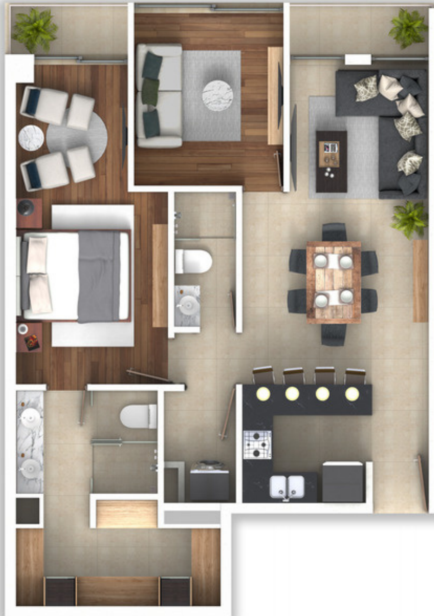
VISTA A JARDÍN INTERIOR