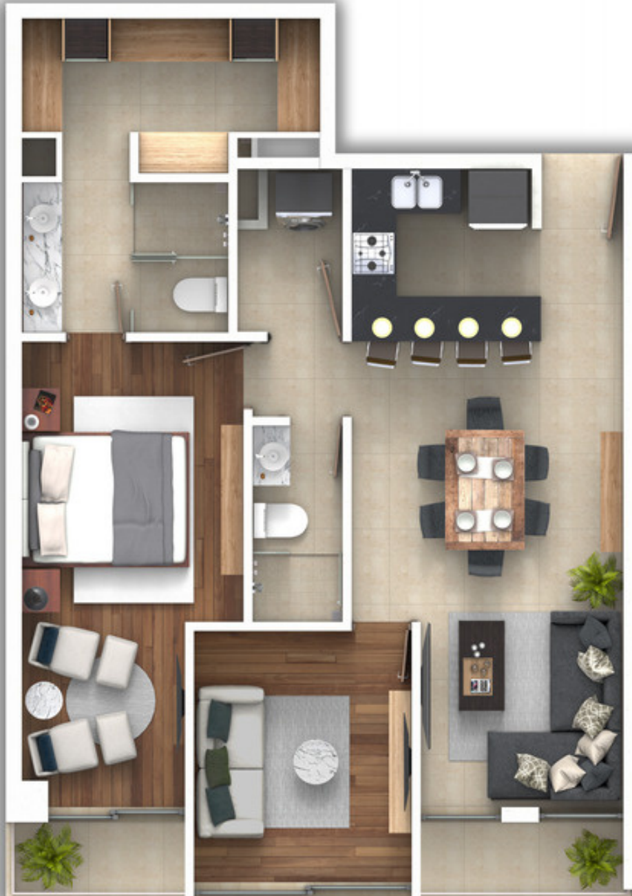
VISTA A CALLE HIPÓDROMO