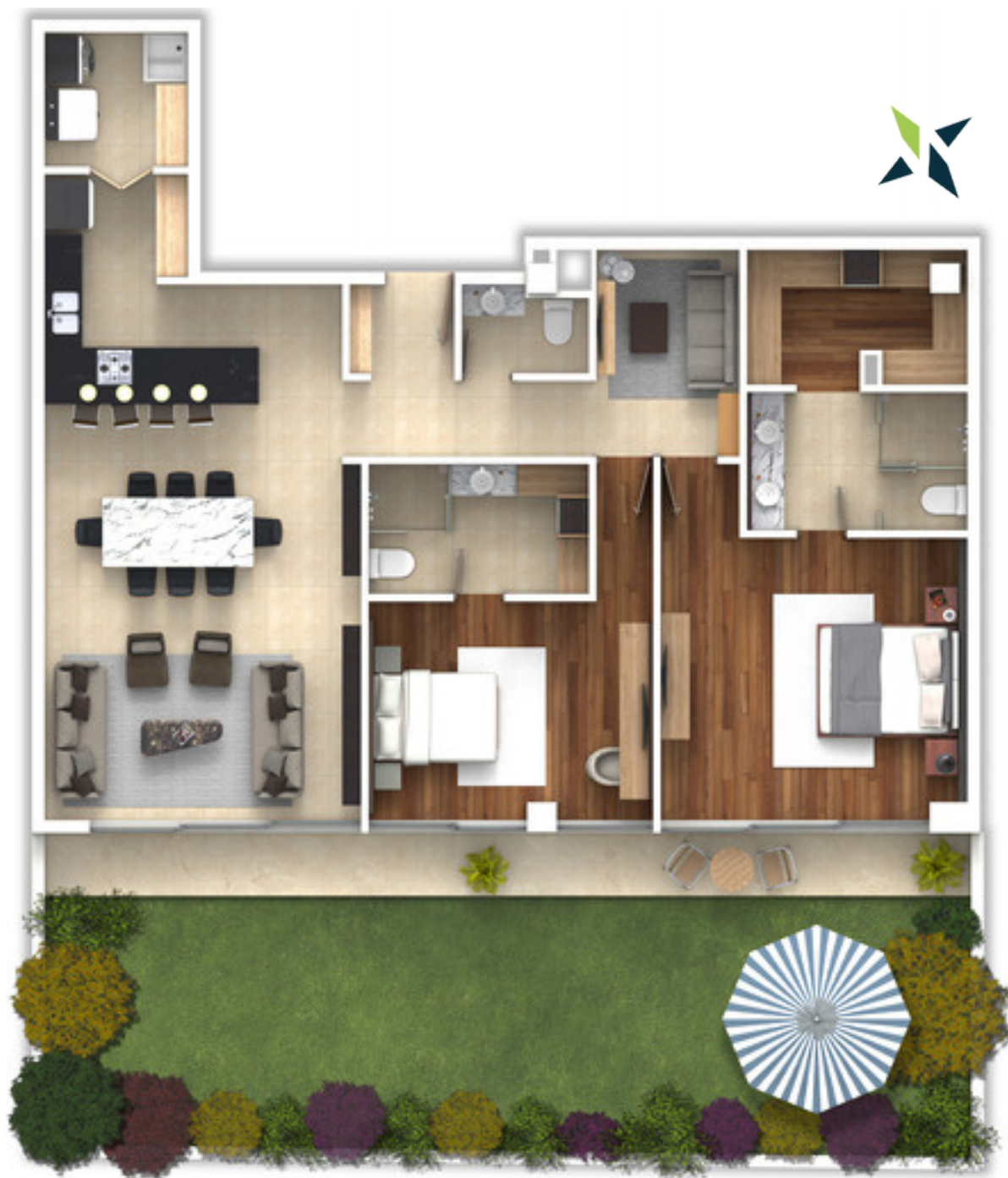
VISTA A CALLE HIPÓDROMO