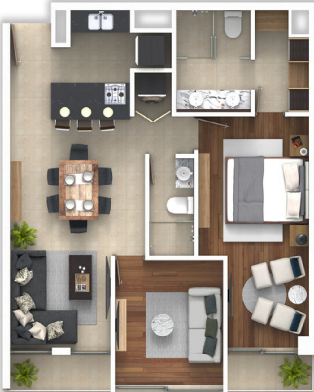
VISTA A CALLE HIPÓDROMO