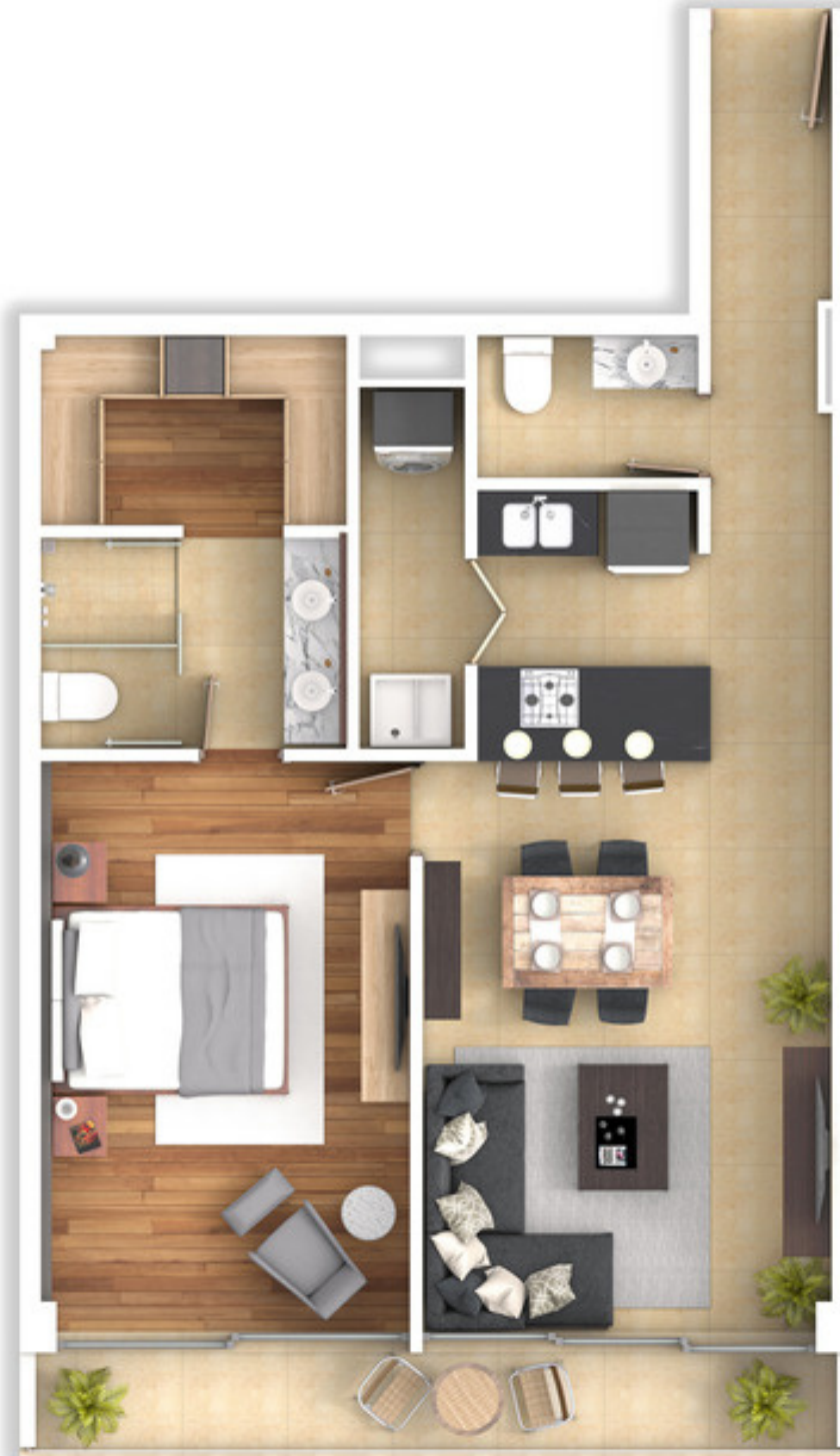
VISTA A JARDÍN INTERIOR