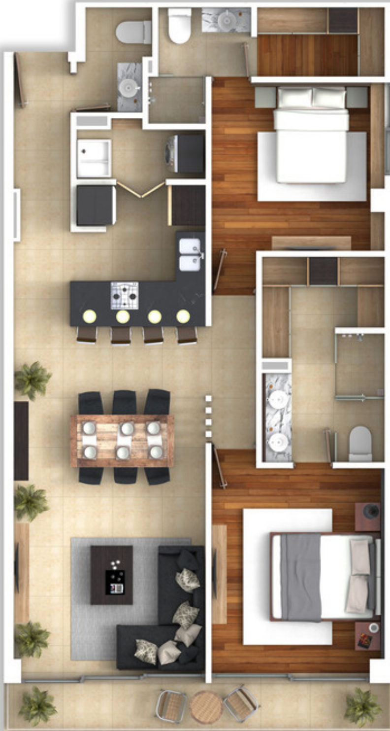
VISTA A JARDÍN INTERIOR