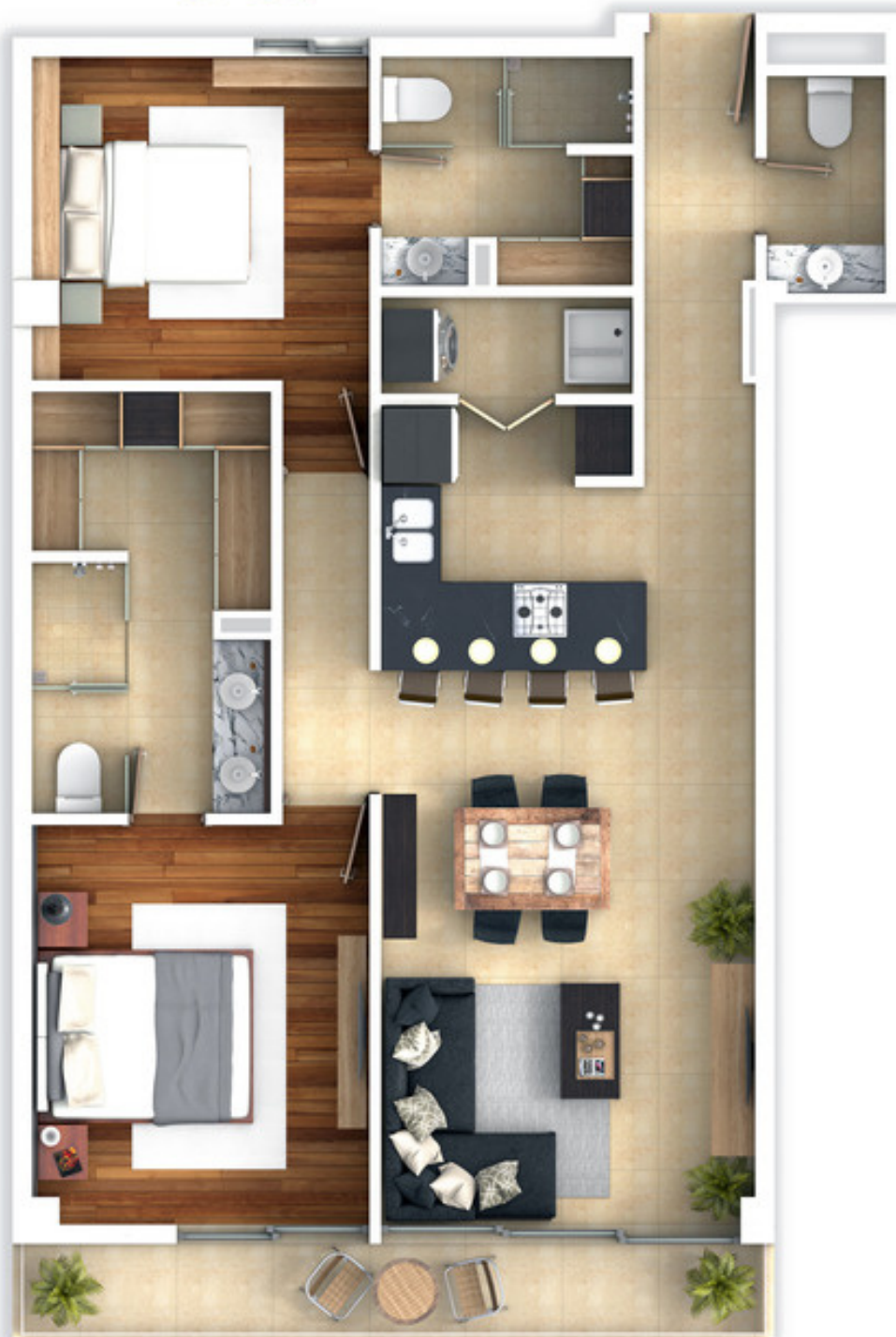
— VISTA A JARDÍN INTERIOR